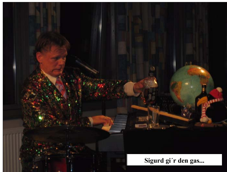
Sigurd gi'r den gas...

Den gennem længere tid annoncerede hemmelige gæst udløste mildt sagt aftenes største oplevelse, idet selveste Mr. Sigurd Barrett dukkede op med sit crazy