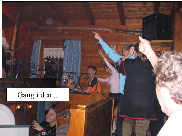
Gang i den...