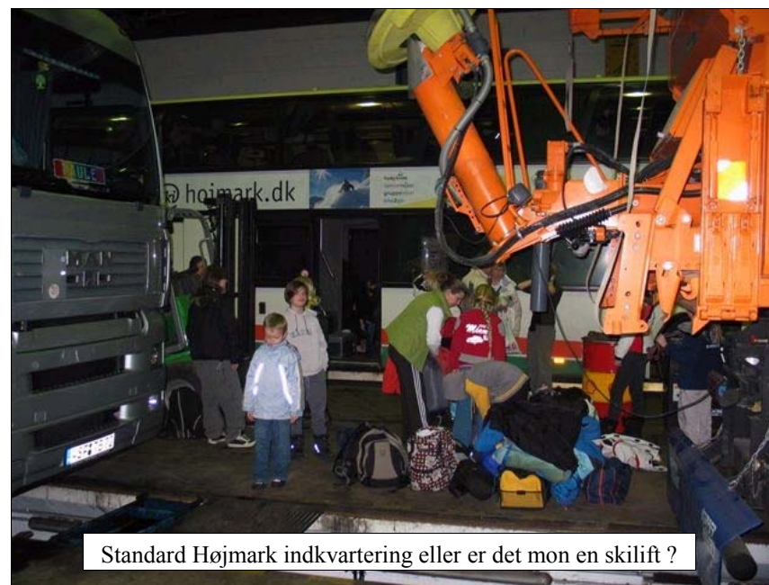
Standard Højmark indkvartering eller er det mon en skilift ?

Et par uger før, begyndte udfordringerne: I instruktør kunne ikke få fri på hjemkomstdagen, og måtte derfor melde fra, men en feberredning fra vedkommendes