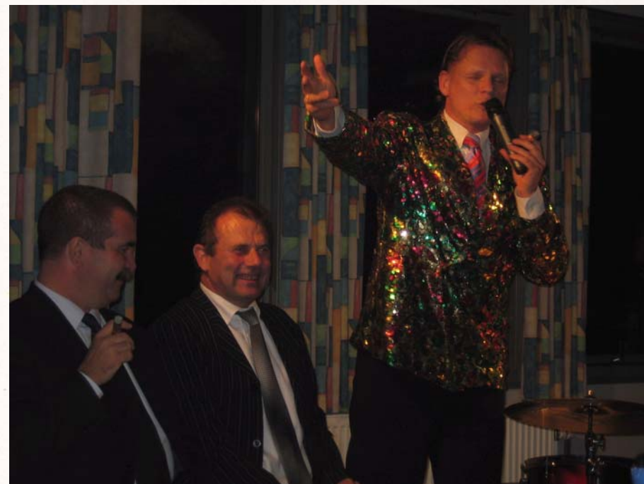
Da Sigurd kom til Glostrup...