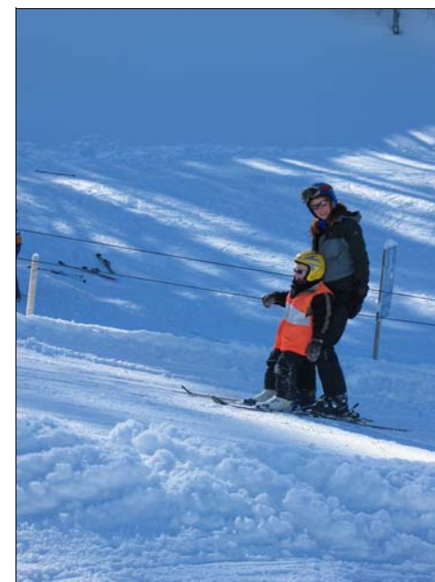
Her går det dog op af...